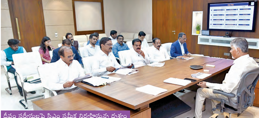
దీపం సర్కిల్నుపై సిఎం సమీక్ష నిర్వహిస్తున్న దృశ్యం

తిరుమల, ఏప్రిల్ 10 ప్రభాతవార్త ప్రతినిధి: తిరుమల ఆలయం తరహాలో తిరుచానూరు పద్మావతి అమ్మవారి ఆలయంలో వార్షిక వసంతోత్సవాలు ఈనెల 30 నుండి మే 02 వరకు తేదీ వరకు భక్తి, వైభవంగా నిర్వహించనున్నారు. ఉత్సవాల మొదటి 29న సాయంత్రం 6 గంటలకు అంకురార్పణ కార్యక్రమం జరగనుంది. భక్తులు ఒక్కొక్కరు 150 రూపాయలు చెల్లించి వసంతోత్సవ సేవలో పాల్గొని అమ్మవారి అనుగ్రహాన్ని పొందవచ్చు. ఉత్సవాలు భారీగా మే 1వ తేదీ ఉదయం 9.30 గంటలకు స్వర్ణ రథోత్సవం కన్నులపండువగా జరుగనుంది. మూడు రోజుల పాటు మధ్యాహ్నం 2.30 నుండి సాయంత్రం 4.30 గంటల వరకు శుక్రవారపు తోటలో అమ్మవారి ఉత్సవమూర్తులకు స్తుతన తిరుమంజనం నిర్వహించ బడుతుంది. రాత్రి 7.30 నుండి 8.30 గంటల వరకు ఆలయ నాలుగు మాడ వీధుల్లో అమ్మవారు విహారిణి భక్తులకు దర్శనమిస్తూ కల్యాణిస్తారు. ఈనెల 28న వసంతోత్సవాలను పురస్కరించుకుని కోయిల్ ఆశ్రాగ్ తిరుమంజనం విశేషంగా నిర్వహించనున్నారు. ఈరోజు ఉదయం సుప్రభాతం అమ్మవారిని మేల్కొల్పి, ఉదయం 6 గంటల నుండి 9 గంటల వరకు ఆలయ శుద్ధి కార్యక్రమం చేపడతారు. ఆలయ ప్రాంగణం, గోడలు, పైకప్పు, పూజా సామగ్రి మొదలైనవన్నీ పవిత్రీకరణలలో శుద్ధి చేయబడతాయి. నామకీర్తన, శ్రీచూర్ణం, కస్తూరి పసుపు, పచ్చాకు, గడ్డ కర్రకారం, గంధం పొడి, కుంకుమ, కిటిలిగడ్డ వంటి సుగంధ ద్రవ్యాలతో కలిపిన పవిత్ర జలాన్ని ఆలయం అంతటా ప్రోక్షణం చేస్తారు. అనంతరం ఉదయం 9 గంటల నుండి భక్తులకు దర్శనానికి అనుమతి జస్తారు. ఈ ఉత్సవాల కారణంగా ఏప్రిల్ 28వతేదీ, 30 నుండి మే 02వ తేదీ వరకు ఆలయంలో కల్యాణోత్సవం, సహ్యాదేవాలకార సేవలను ఆపివేసింది. భక్తులు అధిక సంఖ్యలో పాల్గొని వసంతోత్సవ అమ్మవారి కల్యాణాన్ని పొందాలని టిటిడి ఆలయ అధికారులు కోరారు.